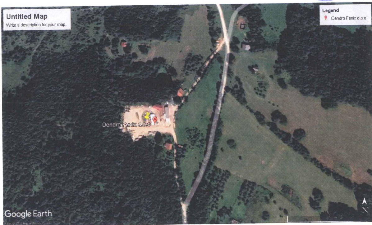
Сл. Приказ локације производних погона

Локација предузећа за прераду трупаца “ДЕНДРО-ФЕНИКС“ д. о. о. Драгњић Подови бб, Шипово налази се у насељу Драгњић Подови, удаљеном 11 км од Шипова. Улаз у пословни простор је изведен са регионалног пута Језеро - Гламоч од којег је предузеће удаљено 6 км.